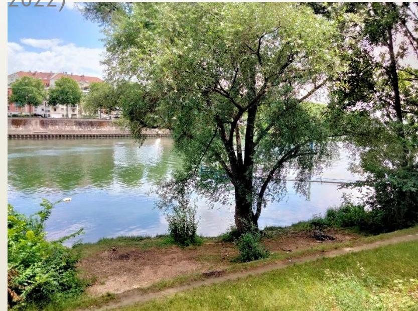
La grève, un espace de « liberté » (Vitry, juin 2022)