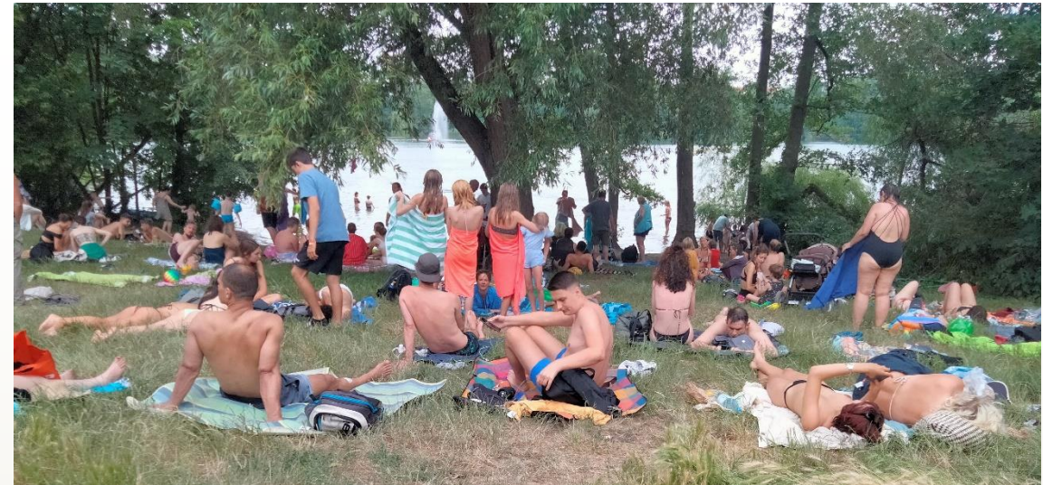
Bain sur un espace interdit à la baignade (Berlin, juin 2022)